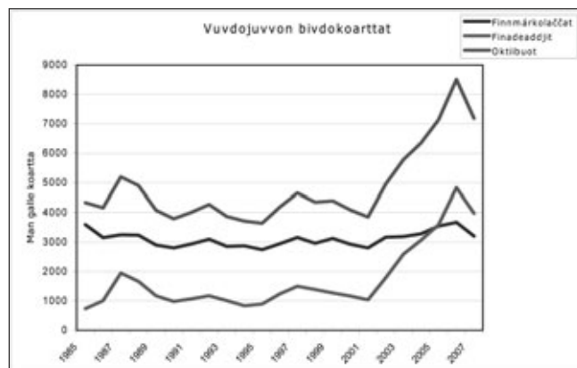
Figvra 1. Vuvdon bivdokoarttaid lohku Finnmarkkus

Guhkes áiggi manjil og bivdiidlogut leat leamaš oalle dássedat lea bivdiidlohku lassánan garrasit manjemus vihtta jagi. Áigodaga 2007/08 vuvdojedje 7185 bivdokoartta. Dát lea niedjan 2006/07 rájes, muhto almmatge nubbin alimus bivdokoartalahku mii lea vuvdon Statskog Finnmarkkus/Finnmarkkuopmodagas. 2005/06 rájes leat leamaš eanet finadeaddjit og finnmarkolaččat bivddus Finnmarkkuopmodagas.